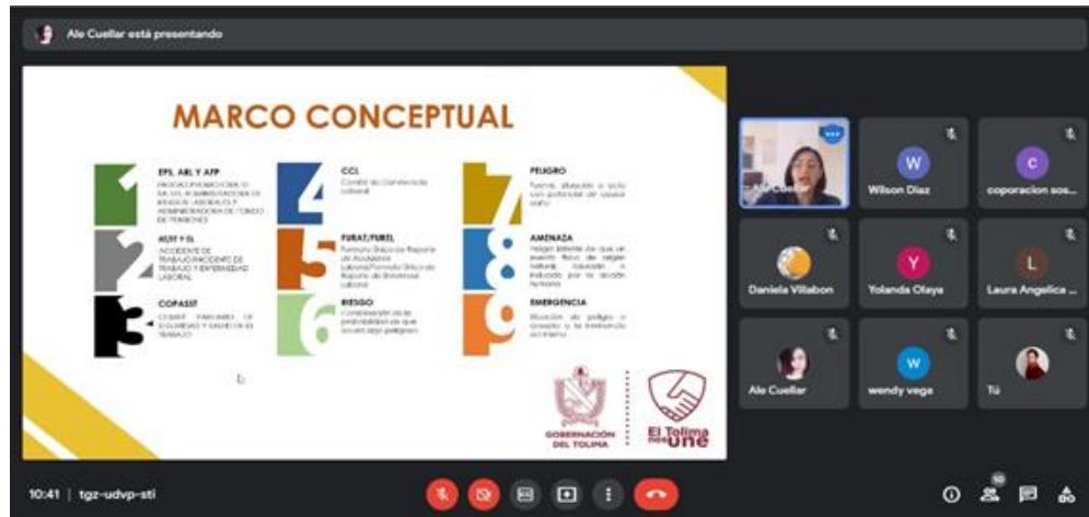
Imagen 2. Capacitación en temas de seguridad y salud en el trabajo